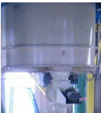
Filtre avec bras ramasseur