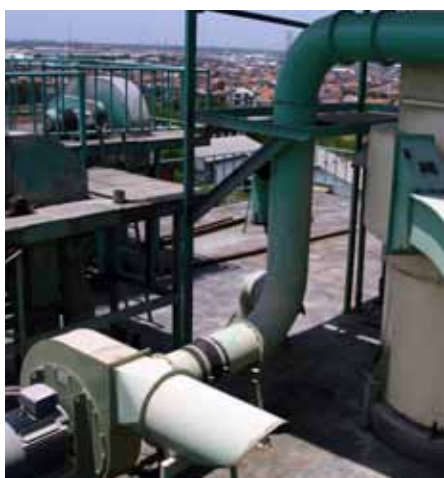
Cyclo-filtre et ventilateur