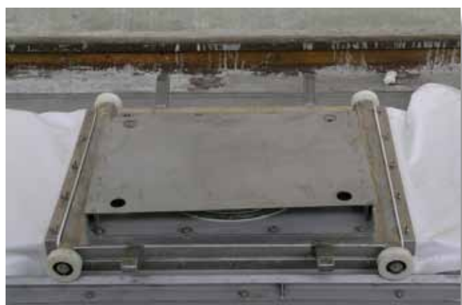
Chariot télescopique en «repos»