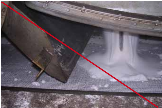
Déchargement sans chariot et à risques de contamination