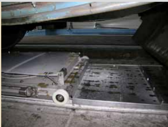
Chariot en cours de positionnement

Afin d'éviter une contamination extérieure de la matière déchargée, le chariot dispose de moyens de cloisonnement et de moyens de protection sous la forme d'un couvercle coulissant.