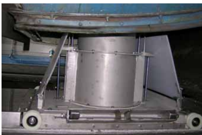
Chariot télescopique en fonctionnement

Une fois le déchargement effectué le conduit revient à sa position initial, couvercle fermé.