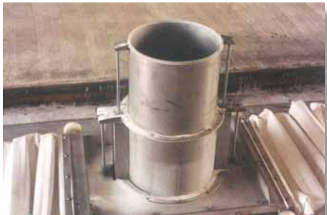
Chariot télescopique de déchargement wagon STOLZ