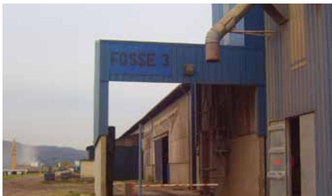
Fosse de déchargement avec double aspiration