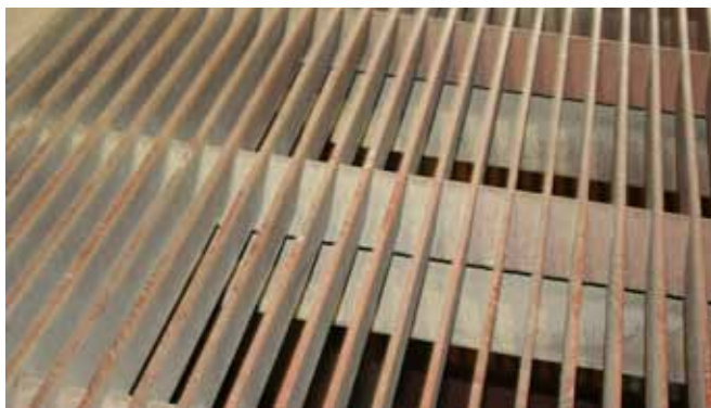
Grille avec structure renforcée